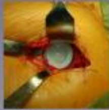
De zijde van het beugelbeen van de heupkop wordt voorbereid en de zijde van het beugelbeen wordt dicht over elkaar.