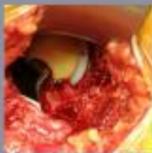
Op de zijkant wordt een opening in de huid gemaakt voor de heupoperatie. De zijkant van de heup wordt dicht over elkaar vastgezet. Het heupoperatie wordt voltooid.