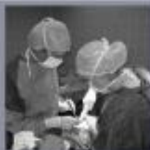
De heupoperatie wordt voltooid en de heup wordt dicht over elkaar vastgezet.