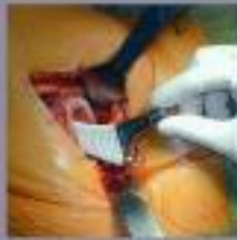
De heupoperatie wordt voltooid en de heup wordt dicht over elkaar vastgezet.