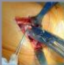
De heupkop van het pootbeen wordt zorgvuldig geprepareerd en vastgezet.